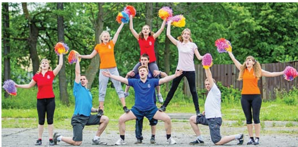
Пирамида от Молодежного совета вне конкуренции