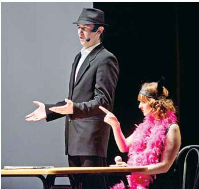
Друзья, молодежная политика на заводе в наших с вами руках

Другим примером результатов деятельности членов Молодежного совета, входящих в рабочую группу, может служить сбор информации о заинтересованности молодежи завода в участии в том или ином мероприятии (выставке, конференции, спортивном турнире, туристическом выезде и др.) и организация самого мероприятия. Совместное участие в разного рода мероприятиях научного, культурно-массового, спортивного характера объединяет и сплачивает молодых сотрудников, способствует укреплению их неформальных связей, что тоже является одной из задач Молодежного совета.