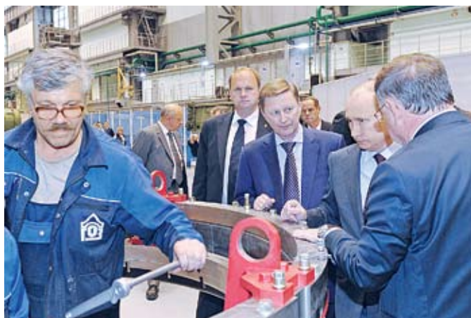
Глава государства осматривает Производственный комплекс № 2

В ходе осмотра производственной площадки генеральный директор Концерна ПВО «Алмаз – Антей» В. В. Меньщиков рассказал главе государства о проекте создания Северо-Западного регионального центра на базе Обуховского завода, об этапах реализации проекта. Президент вспомнил, в каком состоянии находился Обуховский завод в 2002 году до включения в состав Концерна. Включение предприятия в состав Концерна способствовало тому, чтобы вывести промышленного гиганта из состояния банкротства, в котором оно находилось, было необходимо сохранить завод как важнейшее предприятие для военно-промышленного комплекса России. Слыша различного рода отзывы об Обуховском заводе, В. В. Путин давно хотел лично увидеть, как реализуется