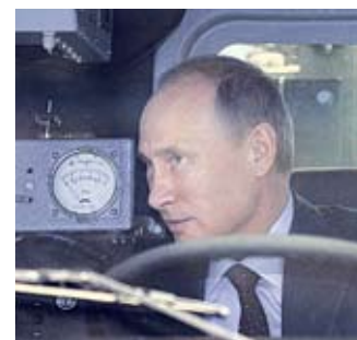
В. В. Путин за рулем пусковой установки ЗРС «Витязь»

Президент, отмечая грандиозность всего проекта, сказал, что ему приятно видеть то, что уже есть сегодня, помня о том, как здесь все было в 90-х. Это не просто стройка и не просто замена одного станка на другой, у нас есть идея, которая реально воплощается в жизнь, во всем прослеживается мысль – и президенту это понравилось. Это хорошо видно на примере ПК-2, ПК-1 и всего СЗРЦ: отсутствие дублирующих