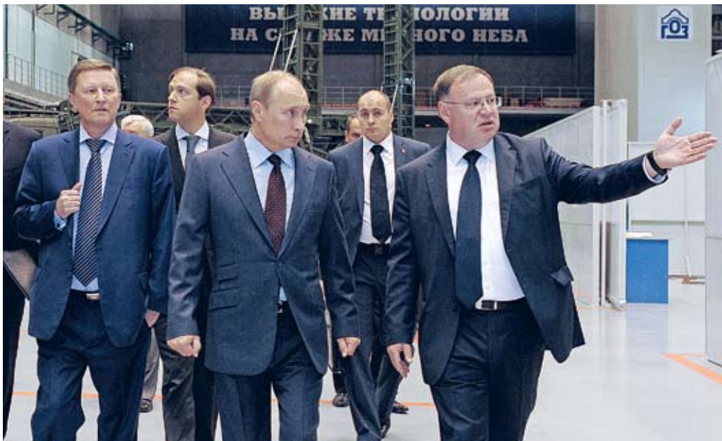
Генеральный директор Обуховского завода М. Л. Подвизников демонстрирует Президенту России В. В. Путину производственные мощности предприятия

Президент России В. В. Путин 19 июня приземлился на вертолете на Обуховский завод. Только поутихли праздничные мероприятия, связанные со 150-летием предприятия, и, казалось, наступили серые будни, как новое событие – визит президента на предприятие.