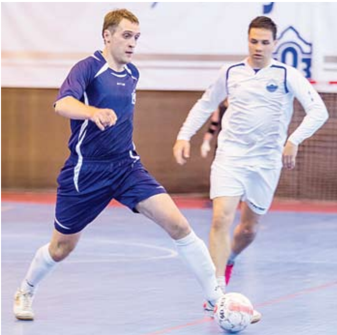
ГОЗ – ЗРТО выход один на один