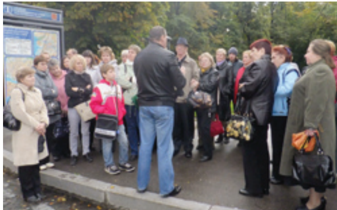
Рассказ о таинственных перепетиях в жизни Павла Первого

Обычный с виду, старый особняк на набережной реки Мойке, скромный – так можно было бы охарактеризовать этот дом с улицы, будь мы людьми непроницательными. Три этажа, желтая краска стен, нет украшений из петербургских атлантов, кариатид. Однако многие знают, какие богатства и ценнейшие коллекции таили в себе эти стены. Семья только в Санкт-Петербурге имела 7 особняков, но жили Юсуповы-старшие и Юсуповы-младшие (два последних поколения в семье перед гражданской войной) именно в этом доме. Вместе. Почти невозможное явление для тех времен и тех доходов. Выкупленный в 1830 году у прежних хозяев особняк стал домом для недавно поженившейся молодой пары. Сочетались законным браком княгиня Зинаида Николаевна Юсупова, последняя на тот момент представительница фамилии, и Феликс Феликсович граф Сумароков-Эльстон. На брак было дано Высочайшее