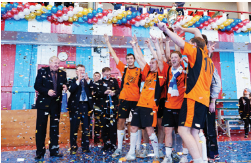
Команда «НИИПРТ» с Кубком победителя Чемпионата