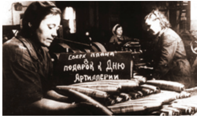
Изготовление снарядов в цехе Обуховского завода

В середине 1943 года на замену старого станка поступил английский строгальный 4-х суппортный со столом 1,5 на 4 метра станок «Бутлер» неопикуемой красоты, точности и простоты управления. Он предназначался для строга-