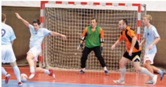
Игровой момент у ворот команды Обуховского завода

Третий тур открывала встреча между «ГОЗ» и «ННИИРТ». Это была игра за первое место в группе, поэтому обе команды начали матч осторожно, пытаясь поймать соперника на ошибке. Первым это получилось у команды из Нижнего Новгорода. Воспользовавшись ошибкой обороны, они повели в счете. Через несколько минут им удалось удвоить свое преимущество, забив гол со штрафного удара. Тем не менее, уже не в первый раз на турнире