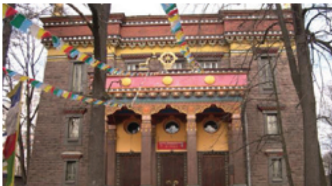
Буддийский Дацан в Петербурге

Петербург – один из крупнейших центров мировой духовной культуры. Именно здесь можно