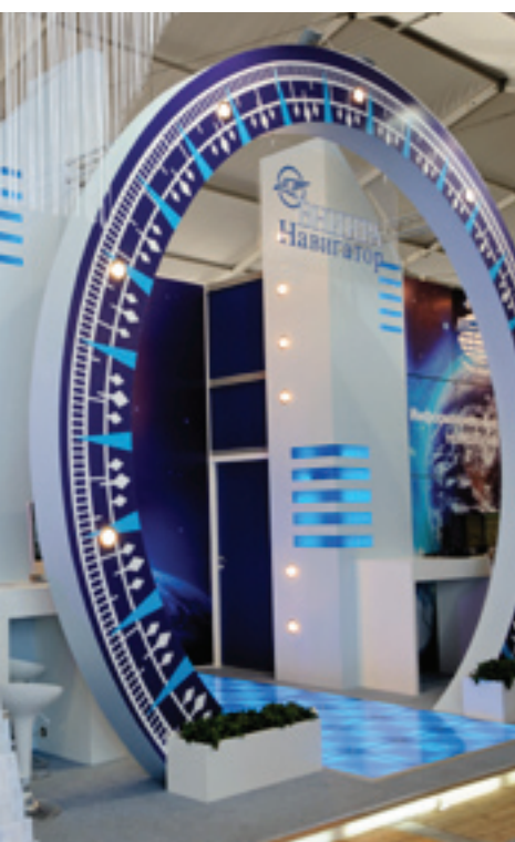
Стенд ВНИИРА на МАКС-2011 – головного разработчика средств управления воздушным движением

КАТАСТРОФ В НЕБЕ. ЗАВЕРШЕНЫ ИСПЫТАНИЯ «ЭЛЕКТРОННОГО ДИСПЕТЧЕРА», СПОСОБНОГО УВЕЛИЧИВАЕТ ВРЕМЯ ДЛЯ ПРИНЯТИЯ ЭКСТРЕННОГО РЕШЕНИЯ. ЕСЛИ СЕГОДНЯ АВИАДИСПЕТЧЕРЫ СИСТЕМНАЯ ЭЛЕКТРОНИКА ВЫЧИСЛИТ ОПАСНОСТЬ ЗА ДВА ЧАСА ДО КАТАСТРОФЫ.